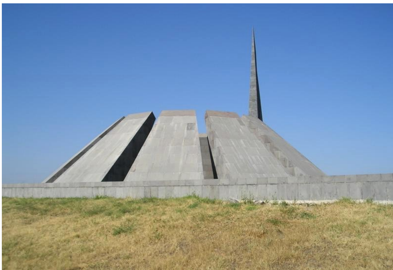
Mémorial du génocide arménien / Yerevan

Institut national de recherche pédagogique/ESCHE (Enseignement des sujets controversés de l'histoire européenne) http://ecehg.inrp.fr