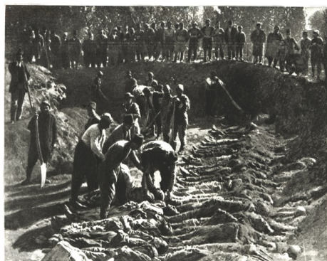
Massacres d'Erzeroum du 30 octobre 1895. Utilisé dans un manuel comme datant de 1915.

Arméniens de la fin du XIXe siècle appelés massacres hamidiens 13 légendée des victimes du génocide arménien ( datant de 1915 et non de 1895).