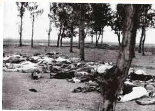
▲ Photographie prise par l'ambassadeur des États-Unis à Constantinople Henry Morgenthau, publiée en 1918.

Témoignage de Garabèd K. Mouradian, 13 décembre 1918, cité dans Revue d'histoire arménienne contemporaine , 1998.